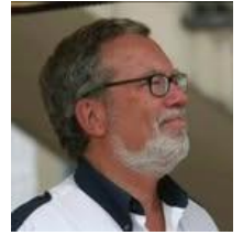
di Gianni Darai

Quest'anno la stagione sportiva motonautica in Adriatico ha preso il via con un programma particolarmente articolato, ricco di eventi e di grande interesse per appassionati e professionisti del settore.