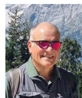
di Diego Vecchiato

Come di consueto, il mese di maggio è stato ricco di eventi, alcuni tradizionali e altri fuori programma. Scopriamoli tutti!